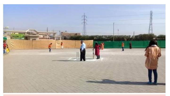
An ongoing cricket match between two teams at Women Campus Faisalabad

Chaati race, three-legged race and Spoon balance race. Cricket, badminton and tug of war were also organized. The program ended with a prize distribution to the winners. Likewise, the official sub-campus in Bhakkar and private-public partnership sub-campus in Mandi Bahauddin celebrated the occasion with much fanfare.