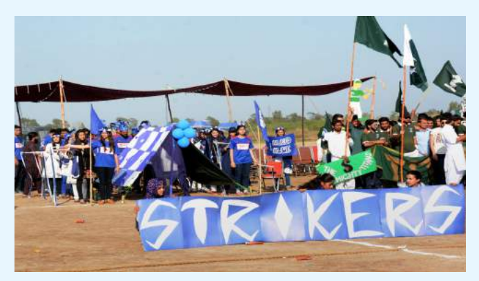
ا کرم نے کہا کہ ہمارامیڈ یکل کالج ملک بھر میں ایک اُمجرتا ہوا اور روثن ادارہ ہے جس کی واضح مثال ہر سال یو نیورٹی آف ہیلتھ سائنسز کے زیر اہتمام منعقد ہونے والے امتحانات میں طلبہ وطالبات کا

واکس چانسلر یو نیورٹی آف سرگودھا ڈاکٹر اشتیاق احمد نے کہا ہے کہ پاکستان کو دنیا کا ترقی یافتہ اور مضبوط ملک بنانے کے لیے ہمیں اپنے نوجوانوں بالخصوص طلبہ وطالبات کو بھر پورمواقع فراہم کرنا ہوں گئے۔ ہمارے باصلاحیت نوجوان ندھرف تعلیم بلکہ ہم نصابی مقابلوں میں بھی بھر پورکار کردگی دکھار ہے ہیں، جس کا آخھیں بطور واکس چانسلر بہت فخر ہے۔ اِن خیالات کا اظہار اُنھوں نے سرگودھا میڈیکل کائے ، یو نیورٹی آف سرگودھا کے سالانہ سپورٹس گالا کی اختا می تقریب کے موقع پر بطور مہمانِ خصوصی کیا۔ اُنھوں نے کہا کہ دورِ حاضر گلوبل ویلئج کی صورت میں موجود ہے، جس میں اقوام کے درمیان ایک خاص مسابقت پائی جاتی ہے اور ہمیں ترتی یا فتہ مما لک کی صف میں کھڑا ہونے کے لیے خود کو ہر مقابلے کے لیے تیار کرنا ہوگا۔ واکس چانسلر ڈاکٹر اشتیاق احمد نے مزید کہا کہ ہرگودھا میڈیکل کائے کے مقابل ت کو وسائل کے مطابق تمام ضروری اقدامات بالخصوص اچھے کھیل کے میدان اور دیگر طلبہ وطالبات کو وسائل کے مطابق تمام ضروری اقدامات بالخصوص اچھے کھیل کے میدان اور دیگر سے مولیات فراہم کی جارہی ہیں نیز جلد ہی ملک بھرسے مزیداعلی متنداور قابل ڈاکٹر بطوراً ستاوتیات