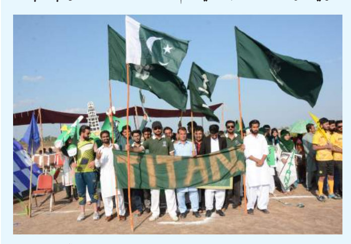
90 فیصد سے زائد نمبر لینا ہے۔ پرنیل ڈاکٹر حمیرااکرم نے اس موقع پروائس چانسلر کو تعلیمی اور ہم نصابی سرگرمیوں سے متعلق گز ارشات بھی پیش کیس ، جس کا وائس چانسلر نے فوری طور پر معاملات کوحل کرنے کا حکم دیا۔ سپورٹس گالا کے اختتام پروائس چانسلر ڈاکٹر اشتیاق احمداور ڈین فیکٹٹی آف سائنس اینڈٹیکنالوجی پروفیسر ڈاکٹر ناظرہ سلطانہ نے کامیاب طلبہ وطالبات میں انعامات تقسیم کیے۔

واکس چانسلر یو نیورٹی آف سرگودھا ڈاکٹر اشتیاق احمد نے کہا ہے کہ پاکستان کو دنیا کا ترقی یافتہ اور مضبوط ملک بنانے کے لیے ہمیں اپنے نوجوانوں بالخصوص طلبہ وطالبات کو بھر پورمواقع فراہم کرنا ہوں گئے۔ ہمارے باصلاحیت نوجوان ندھرف تعلیم بلکہ ہم نصابی مقابلوں میں بھی بھر پورکار کردگی دکھار ہے ہیں، جس کا آخھیں بطور واکس چانسلر بہت فخر ہے۔ اِن خیالات کا اظہار اُنھوں نے سرگودھا میڈیکل کائے ، یو نیورٹی آف سرگودھا کے سالانہ سپورٹس گالا کی اختا می تقریب کے موقع پر بطور مہمانِ خصوصی کیا۔ اُنھوں نے کہا کہ دورِ حاضر گلوبل ویلئج کی صورت میں موجود ہے، جس میں اقوام کے درمیان ایک خاص مسابقت پائی جاتی ہے اور ہمیں ترتی یا فتہ مما لک کی صف میں کھڑا ہونے کے لیے خود کو ہر مقابلے کے لیے تیار کرنا ہوگا۔ واکس چانسلر ڈاکٹر اشتیاق احمد نے مزید کہا کہ ہرگودھا میڈیکل کائے کے مقابل ت کو وسائل کے مطابق تمام ضروری اقدامات بالخصوص اچھے کھیل کے میدان اور دیگر طلبہ وطالبات کو وسائل کے مطابق تمام ضروری اقدامات بالخصوص اچھے کھیل کے میدان اور دیگر سے مولیات فراہم کی جارہی ہیں نیز جلد ہی ملک بھرسے مزیداعلی متنداور قابل ڈاکٹر بطوراً ستاوتیات